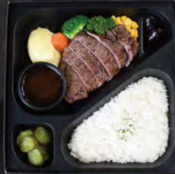
ヒレステーキ弁当 ¥5,000 (税込¥5,400)