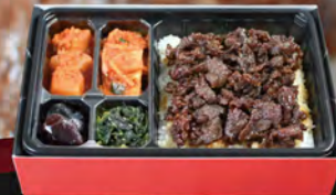
牛薄切弁当 ¥1,500 (税込¥1,620)