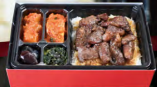
牛切落とし弁当 ¥1,800 (税込¥1,944)