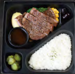
サーロインステーキ弁当 ¥4,000 (税込¥4,320)