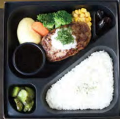
和風おろしハンバーグ弁当 ¥1,800 (税込¥1,944)