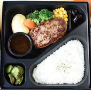
WATAYOSHI ハンバーグ弁当 ¥1,500 (税込¥1,620)