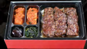
上赤身弁当 ¥2,500 (税込¥2,700)