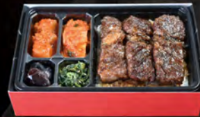
上ロース弁当 ¥2,000 (税込¥2,160)