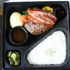
肉祭り弁当 ¥2,000 (税込¥2,160)