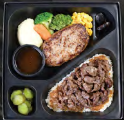
WATAYOSHIコンビ弁当 ¥2,500 (税込¥2,700)