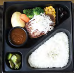
ガーリックハンバーグ弁当 ¥1,800 (税込¥1,944)