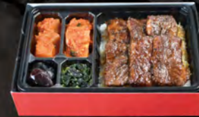
上カルビ弁当 ¥2,500 (税込¥2,700)